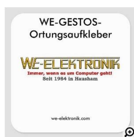
Der Aufkleber kann auch mit Ihrem Firmenlogo gedruckt werden (s. 12.)