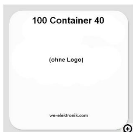
Aufkleber mit Überschrift und beliebiger Fußzeile (s. 3.)