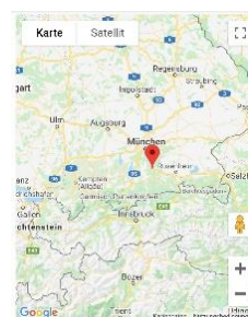
Karte mit Standard-Symbol. (s. 8.)